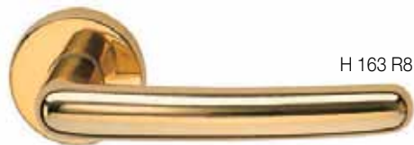
H 163 R8