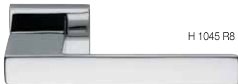
H 1045 R8